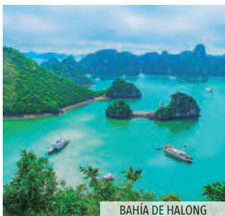
BAHÍA DE HALONG