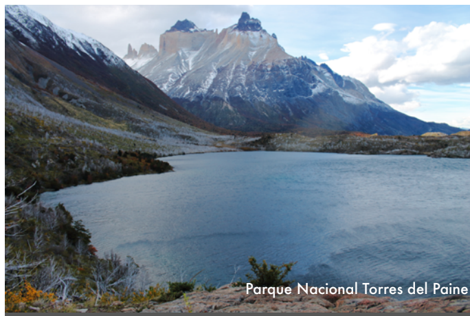
Parque Nacional Torres del Paine