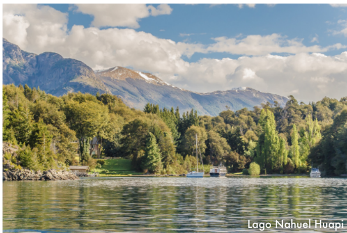
Lago Nahuel Huapi